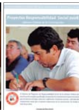
Los proyectos sociales benefician al trabajador de la construcción y a su familia.

sistema de evaluación, en que se trabaja en conjunto con las entidades, empresas, trabajadores y sus familias, los que por cierto, son los beneficiarios directos para lograr una formulación efectiva del mismo.