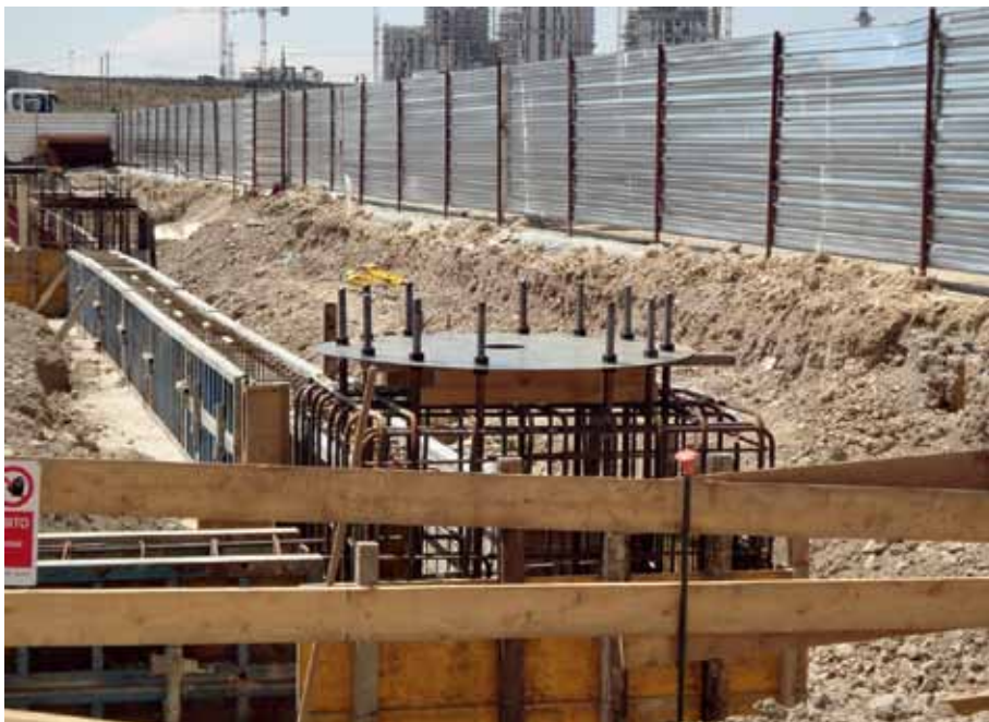
La obra estará sostenida a través de 6 tripodes de pilares metálicos que son de aproximadamente 30 toneladas.

madera laminada como el material que construye y caracteriza el pabellón. Esta, además de su valor sensorial y tectónico, se aprovecharía como un recurso renovable en la cadena medioambiental. Por otra parte, es un material industrializado que permite una calidad homogénea y un adecuado control técnico.