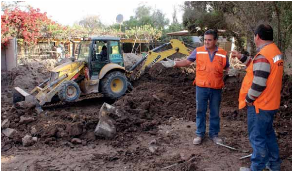
Avenida Francisco de Aguirre.