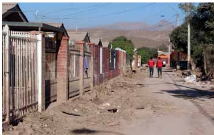
Villa Los Pintores

Después de dos meses de trabajo, la CChC removió 28.500 m 3 de lodo de las calles de Copiapó, lo que equivale a 29 kilómetros de calles despejadas. Para ello se contó con 25 máquinas y un equipo humano de 30 personas.