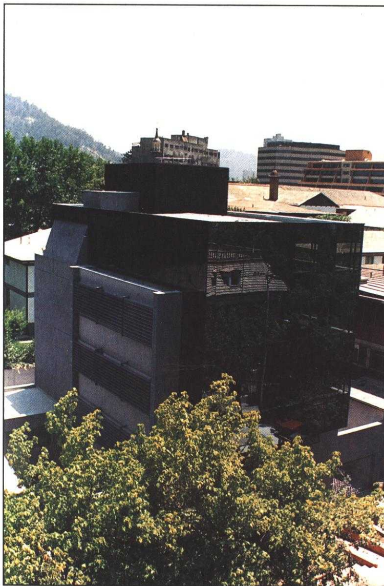
Laboratorio Dental de la Construcción (Servicio Médico)

—En la actualidad el 60% de los trabajadores de la construcción están en las Isapres y el resto está en Fonasa. Para nuestra Institución ello no es especialmente relevante, ya que en nuestros dos ámbitos de acción —bonificaciones y prestaciones— somos absolutamente complementarios a los planes individuales de salud de usuarios afiliados tanto a Fonasa como a Isapres.